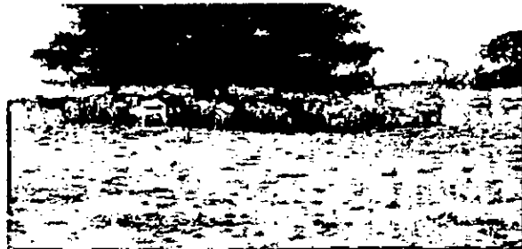
Cercado de elambre cerrado y ganado buscando sombra.

Se observó infraestructura diseñada para impedir el libre tránsito de la fauna silvestre como cercas con tendidos demasiado bajos y densos que no permiten el paso de muchas especies de mamíferos herbívoros. El manejo que se le estaba dando a la fauna silvestre, en el caso de chigüiros y venados está orientado a considerarlos "plagas" pues consumen los recursos del ganado vacuno; cuando se preguntó sobre "por qué tenía tendidos tan cerrados en las cercas (normalmente son cuatro) con siete tendidos", el propietario comentó que "era para que los chigüiros y los venados no compitieran con el ganado por las pasturas y no le emporcaran el agua de los caños y abrevaderos" esta actividad está afectando los ciclos naturales y de flujo energético y orgánico que se desarrollan en estos ecosistemas, además la ganadería extensiva promueve el contagio de enfermedades a los animales silvestres.