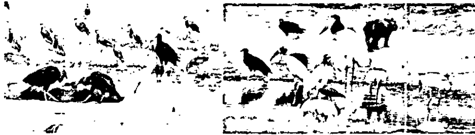
Efectos de la sequía en el predio la Arandia.

Es importante agregar que la principal actividad económica de los propietarios es la ganadería, y los animales transitan constantemente desde y hacia el río (Caño Guajibo) abriendo caminos entre la vegetación que crece en la zona de ronda.