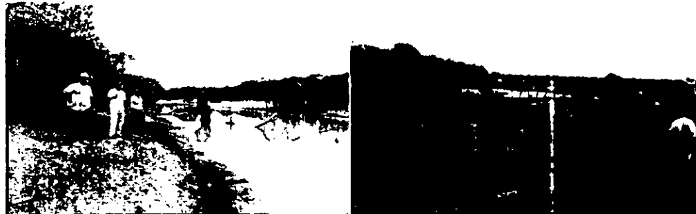
Construcción de jarillones para represamiento del caño Guajivo.

Con respecto a los numerales 4, 5 y 6 consideramos que las diferentes actividades que se están desarrollando no están contribuyendo a dar un buen ejemplo sobre el manejo que se debe dar al predio; no está generando sensibilización y concientización ambiental además no se reconoce la función ecológica de la propiedad privada.