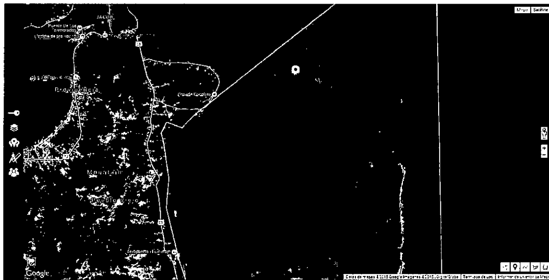
Figura 1. Sitio de realización de actividades de filmación en Cayo Cangrejo –Crab Cay- al interior de zona de recreación general exterior del PNN Old Providence Mc Bean Lagoon.

Este sendero hace parte de la Subzona de Recreación General Exterior Cayo Cangrejo, localizada en la porción marina del Parque, comprende el área terrestre de Cayo Cangrejo y una franja marina de veinte (20) metros de ancho alrededor de él. Su uso principal es de recreación y los complementarios los de educación, cultura, investigación, recuperación y control. Las actividades permitidas en estas zonas son las de investigación, las de monitoreo, el tránsito de embarcaciones con motor y sin motor, la construcción de infraestructura de apoyo, los deportes acuáticos en embarcaciones sin motor (kayak, natación, velerismo). Lo anterior incluye el uso del recurso paisajístico en el desarrollo de proyectos audiovisuales de filmación y/o fotografía con autorización previa de Parques Nacionales.