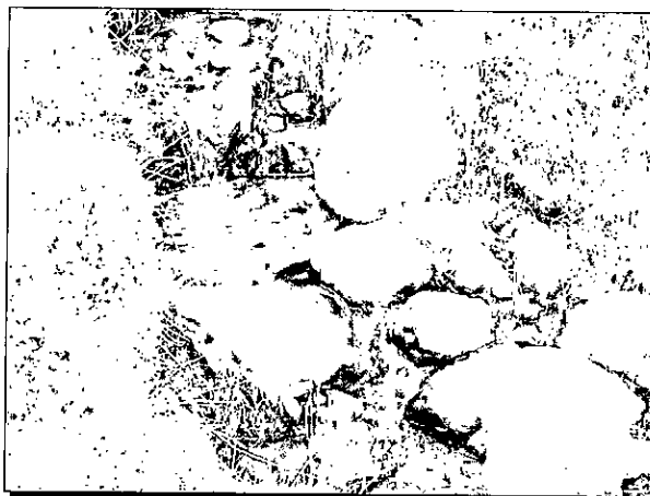
Figura 1. Hidrología del predio "El Sinú".