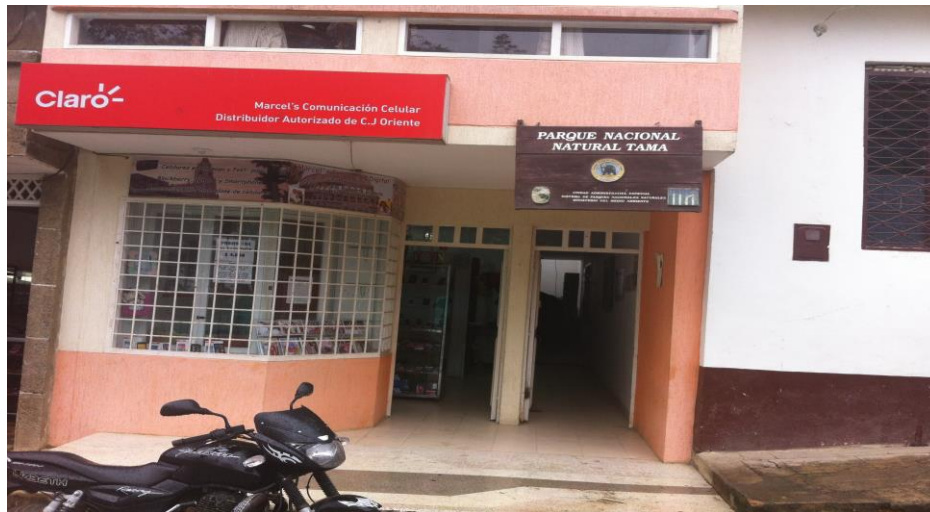
FOTO: Sede Administrativa del PNN TAMÁ, Toledo – Norte de Santander