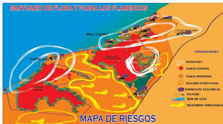
Imagen tomada de la matriz del Plan de Emergencias SFFF.

Por todo lo anterior, el Santuario de Fauna y Flora Los Flamencos requiere contar con un Plan de emergencias que oriente las acciones y medidas a realizar frente a las distintas situaciones de riesgo, y que a su vez propenda por minimizar los efectos sobre los ecosistemas, los distintos grupos humanos y sus pertenencias, la plantilla de funcionarios, así como los bienes muebles e inmuebles al servicio del AP. (...)