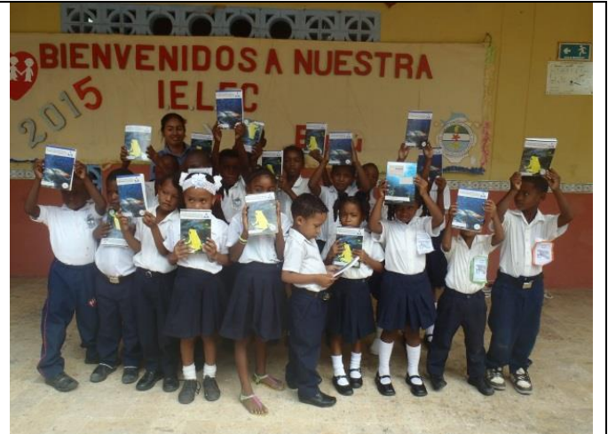
Breve charla informativa en el momento de la entrega y entrega a los cursos de primero y segundo.

INSTITUCIÓN EDUCATIVA DE ARARCA E INSTITUCIÓN EDUCATIVA SANTA ANA BELLA (ARARCA Y SANTA ANA)