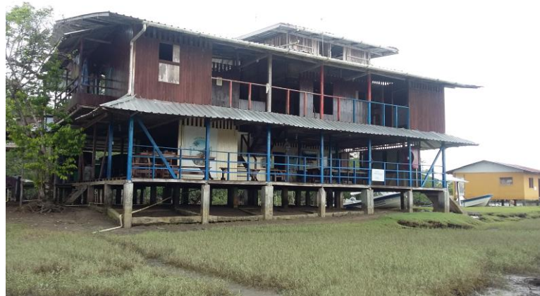
FOTO: Sede Administrativa del PNN SANQUIANGA, vereda Mulatos, municipio La Tola - Nariño

Hay que realizar mantenimiento completo. También es importante diseñar un espacio para la ubicación de los funcionarios en el desempeño de sus labores en los micros portátiles, y adecuar la sede con escritorios y sillas ergonómicas. La ventilación y la luz natural de la sede son excelentes. Si hay graves contratiempos es con la energía eléctrica que se surte en parte desde paneles solares y una planta a gasolina que son propiedad del Parque y una planta de ACPM que presta el servicio a la comunidad y que funciona regularmente de 06:15 de la tarde, más o menos, hasta las 10:00 p.m. De ahí que es urgente que se destine un presupuesto para instalar unos paneles solares con capacidad para suministrar energía las 24 horas. Un óptimo servicio de energía eléctrica garantiza poder mejorar los sistemas de comunicación con los otros Niveles de Gestión.