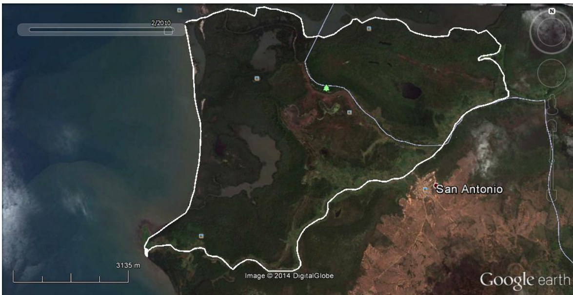
Recorrido perimetral SFFCMH.

Durante la vigencia 2015 se efectuaron 44 recorridos, los cuales se encuentran incorporados en el aplicativo Smart.