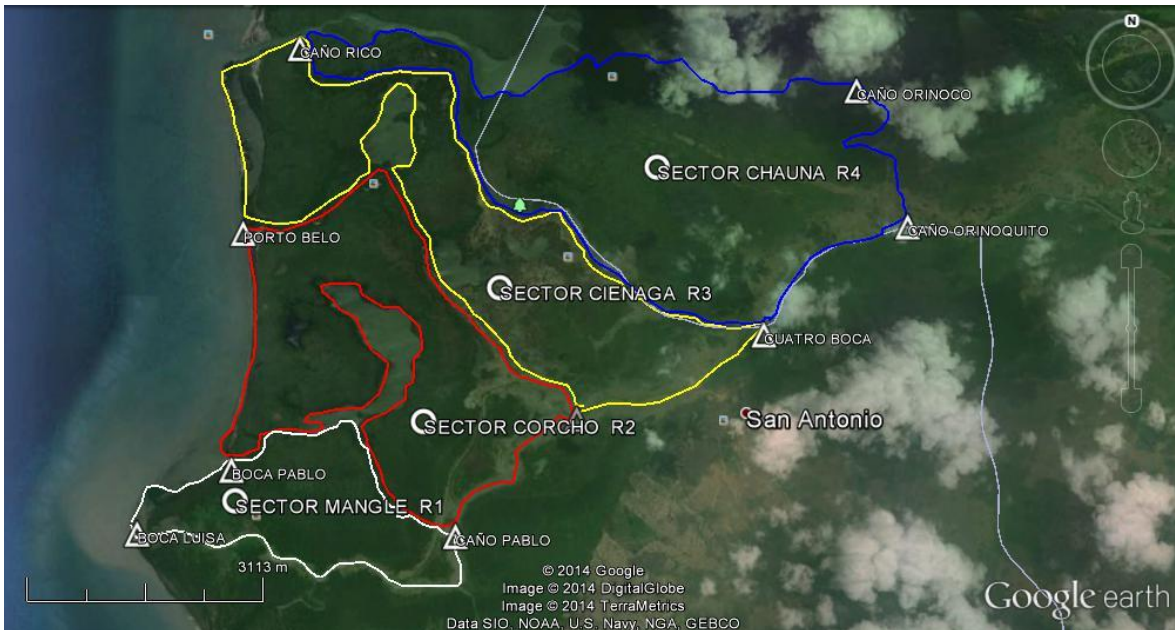
Recorrido sectores y rutas SFFCMH.