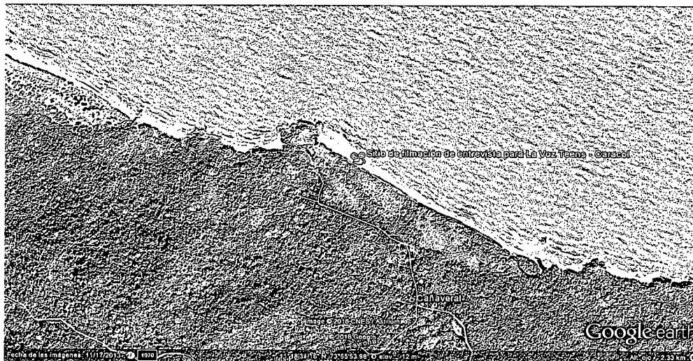
Figura 1. Ruta o sendero para el día 01 – Calabazo - Pueblito Chairama – Cabo San Juan del Guía – La Piscina – Arrecifes – Cañaveral, en Zonas Histórico Cultural y de Recreación General Exterior de PNN Tayrona