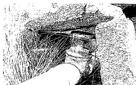
Foto 4. Válvula reguladora de caudal

Desarenador: El desarenador se encuentra aproximadamente a 100 de la bocatoma, se encuentra aislado con una cerca para evitar el contacto con animales que puedan introducir elementos al agua.