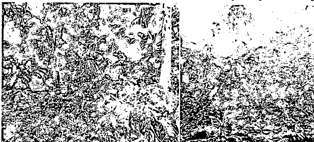
Imagen 1. Bosque muy húmedo tropical (Bmh-T).

Según el Plan Básico de Ordenamiento Territorial para la zona en donde se ubica el predio Aguapanela se reporta una precipitación promedio anual de 5500 mm, una temperatura media de 25 °C y una altura que oscila entre 41 – 111 msnm (datos obtenidos en campo). Dadas las características anteriores, el predio se incluye en la zona de vida de Bosque muy húmedo tropical (Bmh-T) de la clasificación climática según rangos de Holdridge 3 .