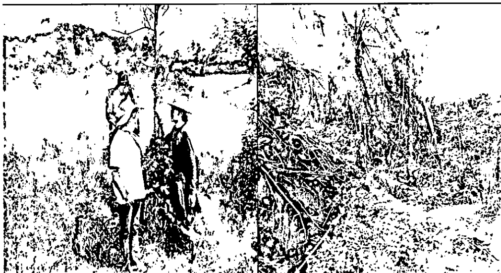
Foto 1. Bosque Andino RNSC El Cardón.