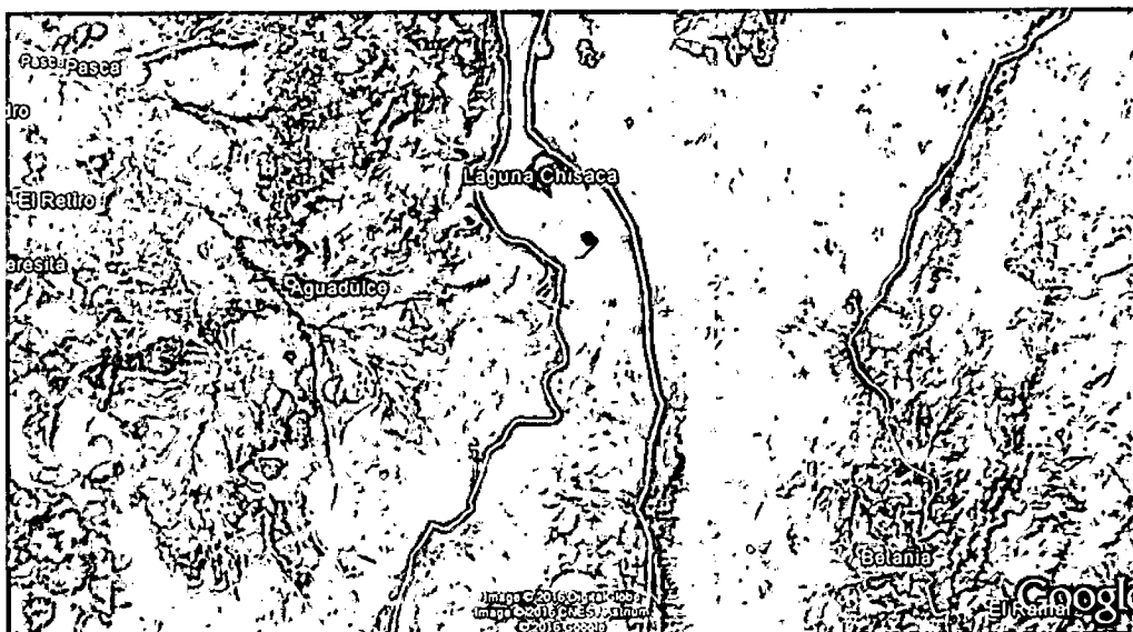
Figura 1. Sitio autorizado para llevar a cabo filmación al interior del PNN Sumapaz: Terraplén de la Laguna de Chisacá y áreas cercanas a esta laguna. En la vereda Chisacá de la Localidad de Usme, Distrito Capital.