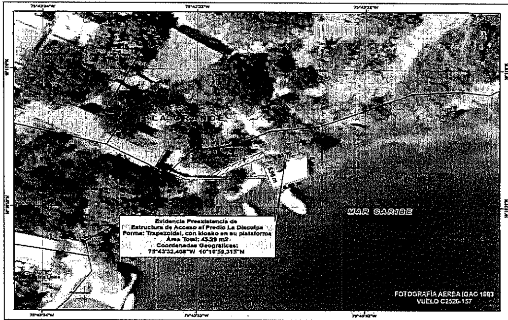
Figura N° 4.- Fotografía aérea IGAC 1993 – vuelo C2526- donde se observa la infraestructura preexistente para su reparación con sus dimensiones.