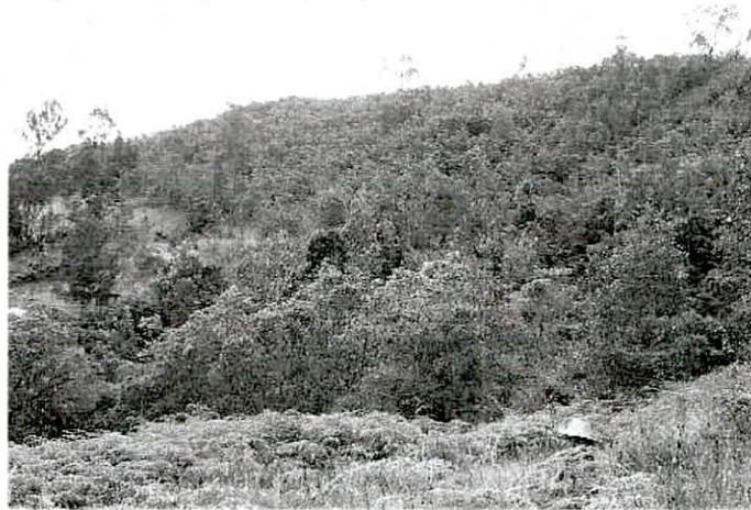
Imagen No. 2: Vegetación riparia y conectividad con RNSC JACAMAKI.

La muestra de "Bosque Andino o Bosque de Niebla" presente en el predio "LOTE NO. UNO (1)" alberga especies como: Roble ( Quercus humboldtii ) 1 , aliso ( Alnus acuminata ), arrayan ( Myrcianthes leucoxylla ), juco ( Viburnum tinoides ) y mano de oso ( Oreopanax floribundus ), variedades de musgos y helechos; el sotobosque es denso, de difícil acceso, compuesto por rastrojos y bosque en recuperación. La reserva contribuye con la protección de una quebrada, la cual se encuentra ubicada en uno de los límites del predio que se conecta con la RNSC JACAMAKI; esta zona se encuentra conformada por vegetación riparia otra zona con vegetación en proceso de crecimiento.