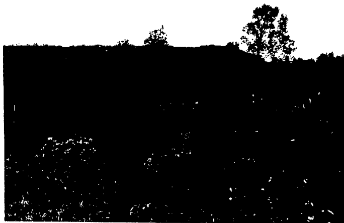
Zona de Amortiguación.

Se proyecta desarrollar agrosistemas bajo tecnologías limpias y de producción sostenible para huertas ecológicas, apicultura y lombricultura; uso de energías alternativas renovables solar, hidráulica y eólica; recuperación de suelos para producción de abonos verdes. Es una zona ondulada, se ubica en el extremo norte oriental del predio en un relieve plano a ondulado con pendientes entre 1 - 3 y 3 - 7%.