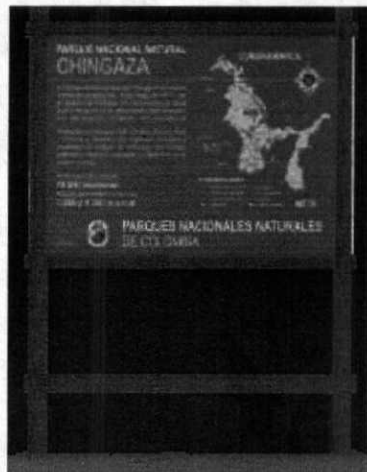
Valla tipo I