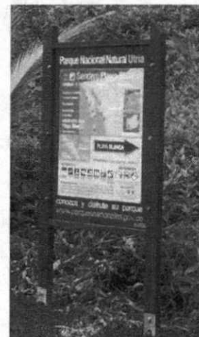
Valla tipo II