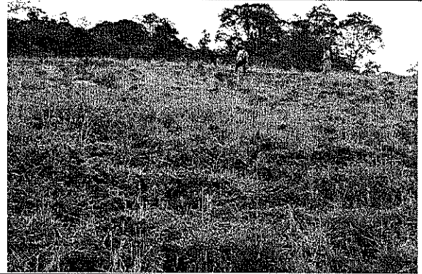
Aspecto del terreno arado con yunta de bueyes, varios después de la afectación. Volteo de los primeros 10-15 cm del suelo