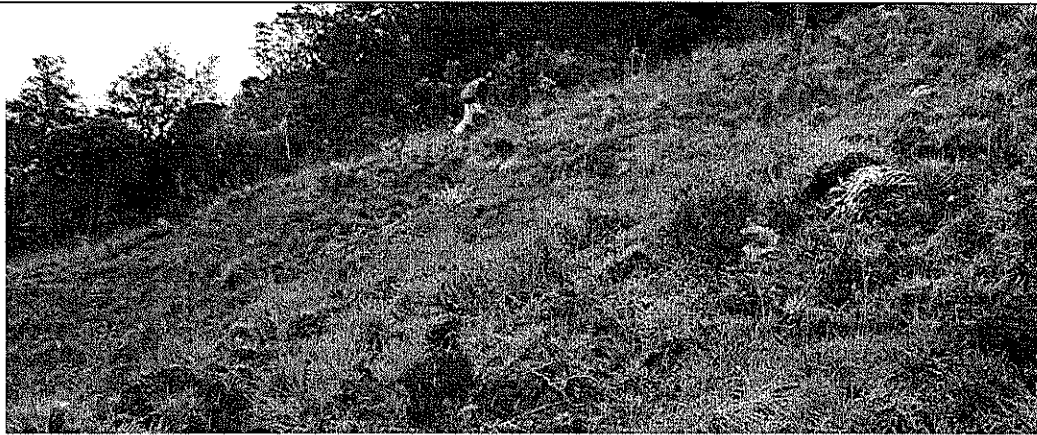
En el terreno arado, se observan individuos muertos de la especie Espeletia tunjana ; otros individuos de la misma especie sobrevivieron, probablemente porque la labranza del terreno estaba inacabada cuando se interrumpió la labor