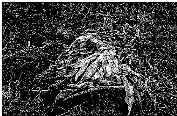
Detalle de Individuo de Espeletia tunjana muerto