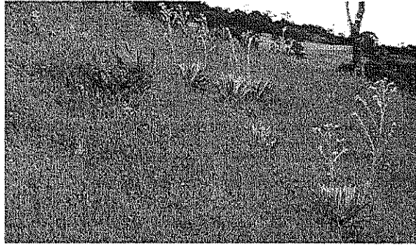
Aspecto de la vegetación pre-existente a la afectación. Se observan individuos dispersos de frailejón ( Espeletia tunjana ) y de otras hierbas en una matriz de gramíneas naturales