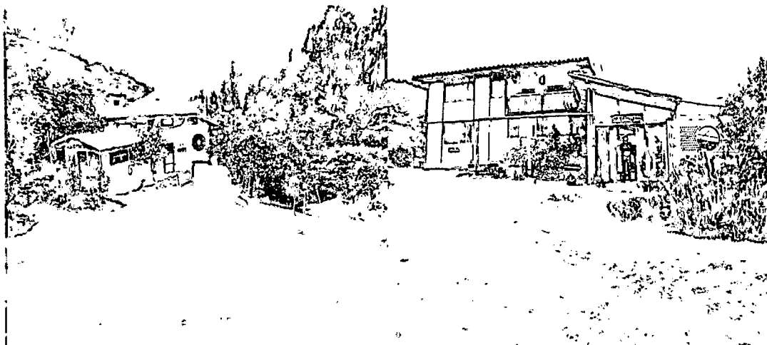
Zona de Uso Intensivo e Infraestructura.