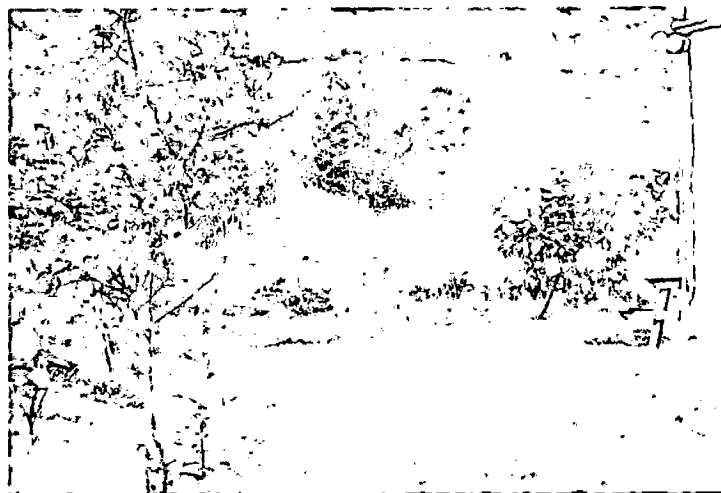
Zona de Agrosistemas.