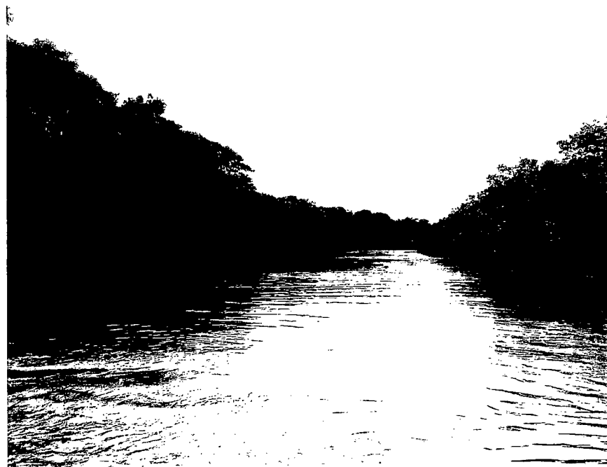
Imagen No. 1 y 2: Muestra de ecosistema.

Las sabanas inundables y no inundables constituyen la mayor extensión de la RNSC Miravalles, están conformadas por un estrato herbáceo bajo y poblaciones de gramíneas densas algunas nativas adaptables a las condiciones climáticas de humedad y sequía extrema, lo que permite a los propietarios desarrollar la ganadería tradicional como principal actividad productiva.