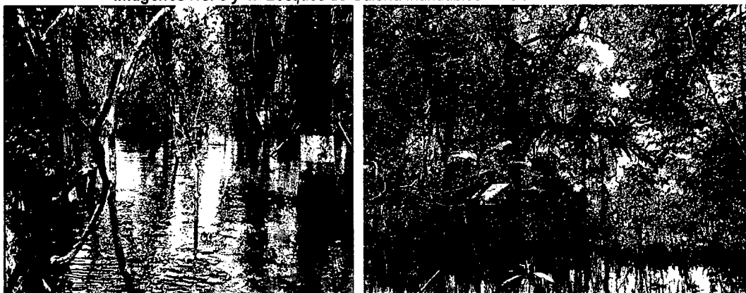
Imágenes No. 3 y 4. Bosques de Galería Inundables RNSC "MIRAVALLÉS".