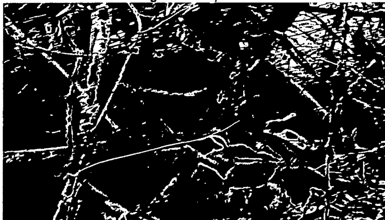
Imagen 7: Oso palmero.