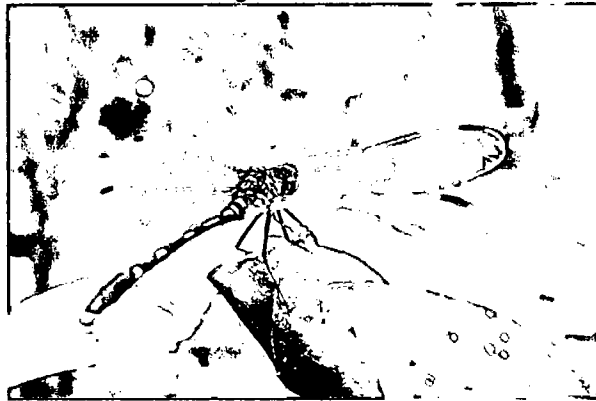
Imagen 10: Libélula.