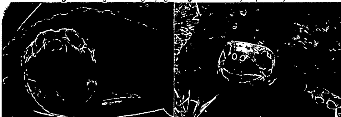
Imagen 5: Tortuga de río o galápago Imagen 6: Morrocoy de patas rojas.