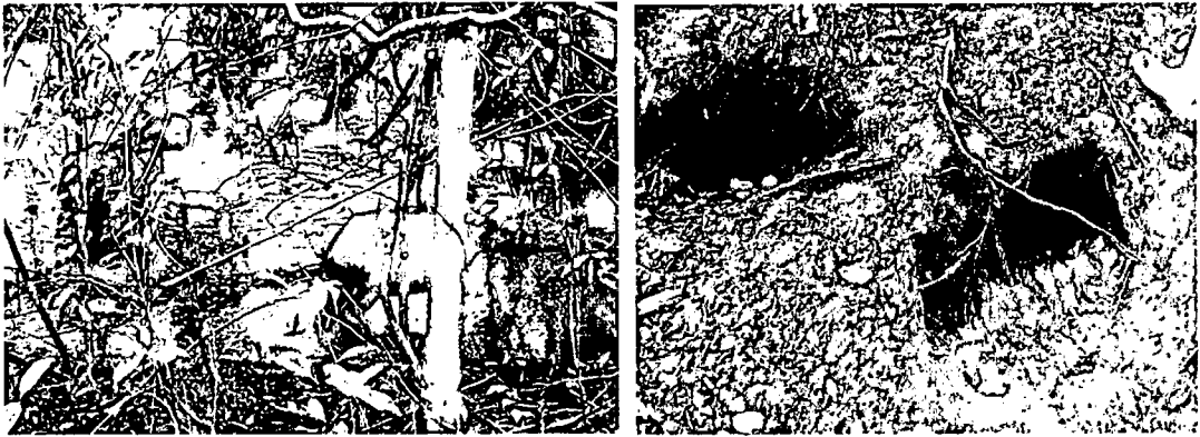
Imagen 8: Chigüiro. Imagen 9: Madriguera de Nutria.