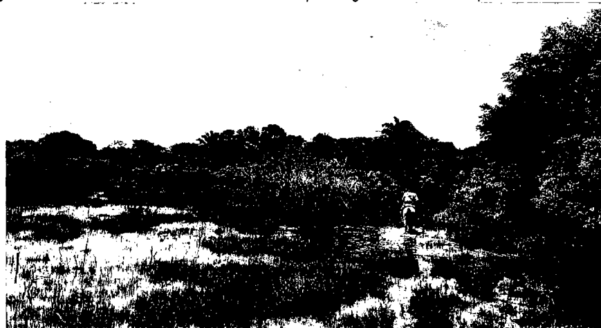
Imágenes No. 1: Muestra de ecosistema de "Bosque de galería Inundable" presente en la reserva.

La muestra de ecosistema presente en el predio "Padrote" posee una importante conectividad ecológica con las Reservas Naturales de la Sociedad Civil vecinas permitiendo la función ecosistémica relacionada con la regulación del clima, la protección y regulación del recurso hídrico, la retención de nutrientes y la provisión de condiciones apropiadas para el desarrollo de poblaciones de especies de fauna y flora.