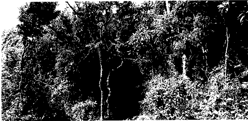
Bosque Alto-andino Zona de conservación.

Esta cobertura se ubica principalmente en el predio La Grecia No 1 donde también se encuentra la vivienda. Comprende los territorios cubiertos por bosques naturales donde se ha presentado intervención humana de tal manera que el bosque mantiene su estructura original.