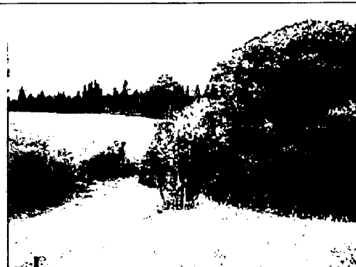
Foto 2. Panorámica del predio, a la derecha bosque ripario, al fondo embalse del Neusa. Predio "Entrequebradas". RNSC a denominarse "Naturaleza Real", vereda Páramo Bajo, municipio de Tausa, Cundinamarca