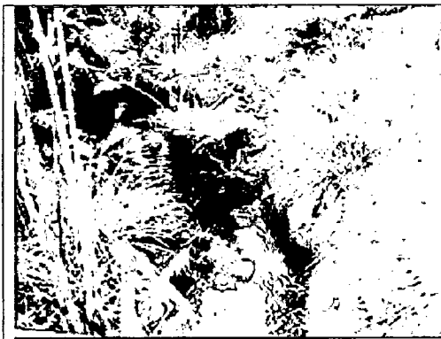
Foto 1. Quebrada que discurre por lindero. Predio "Entrequebradas". RNSC a denominarse "Naturaleza Real", vereda Páramo Bajo, municipio de Tausa, Cundinamarca (Enero 13 de 2017)

La Empresa de Acueducto, Alcantarillado y Aseo de Bogotá ESP, en el marco de uno de sus proyectos de conservación, restauración y uso sostenible de servicios ecosistémicos de páramos, contrató la formulación del Plan de Manejo Ambiental 1 para los predios a denominarse RNSC "Naturaleza Real", en donde en el documento diagnóstico se establece para el componente Flora y fauna lo siguiente: