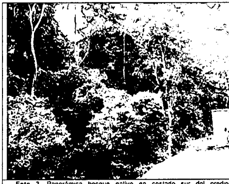
Foto 3. Panorámica bosque nativo en costado sur del predio "Entrequebradas". RNSC a denominarse "Naturaleza Real", vereda Páramo Bajo, municipio de Tausa, Cundinamarca (Enero 13 de 2017)

Informe Técnico DGOAT No. 0296 de 10 de noviembre 2017