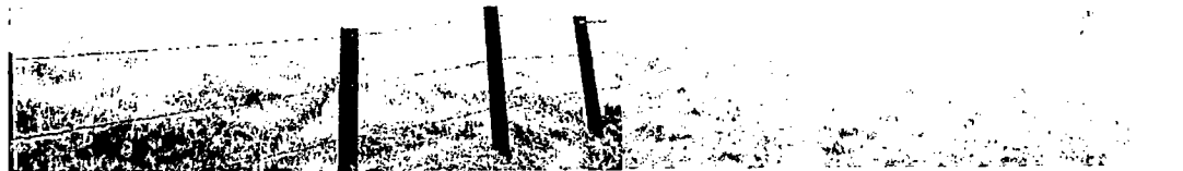
Zona de Agrosistemas.

Zona de Uso intensivo: Está ubicado en una zona más o menos central del predio donde se encuentra una pequeña cabaña utilizada más que todo para guardar herramientas e insumos agropecuarios. Tiene una extensión de 0.0501 ha.