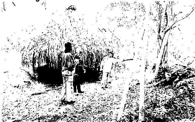
Imagen No. 2. RNSC "PARCELA 3 GUASIPUN".