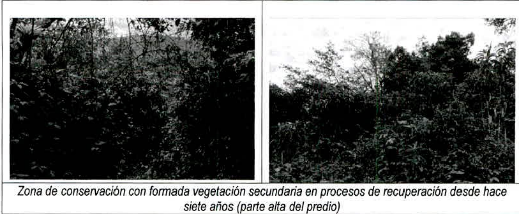
Zona de conservación con formada vegetación secundaria en procesos de recuperación desde hace siete años (parte alta del predio)

1,0174 ha conforma la mayor extensión de la reserva. Comprende un ecosistema ampliamente dominado por vegetación secundaria en proceso de recuperación desde hace siete años, y se distribuye en la parte alta de predio. Linda con predios dedicados mayormente a la ganadería tradicional en pastos naturales. Aunque en el contexto local hay presencia de remanentes de bosque de roble ( Quercus humboldtii ), en el predio esta especie es casi ausente. Con la recuperación de la vegetación, al tiempo, se pretende ir recuperando progresivamente la regulación hídrica perdida por la desaparición de la vegetación original que existió en el predio Itaca. El ojo de agua y los reservorios del predio son afluentes de la Quebrada La Cebada.