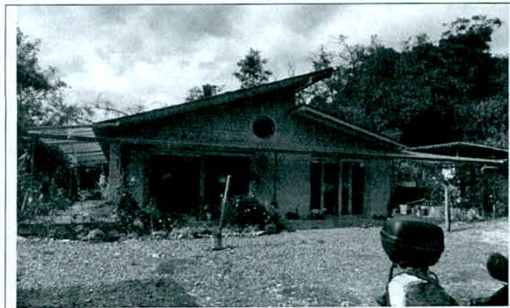
Zona de uso intensivo (vivienda y parqueadero) Itaca.

Tiene una extensión de 0.0357 ha y se localiza en al centro del predio y está conformada por la casa de vivienda, área de la vía de acceso a la misma.