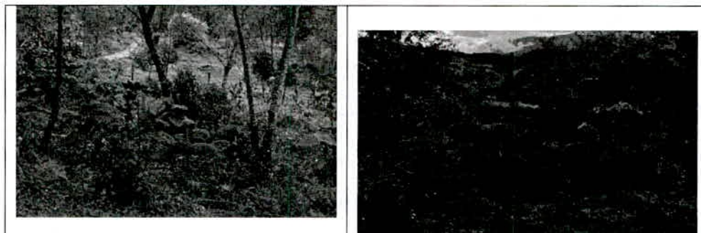
Zona de agrosistemas. Se cultivan frutales propios del clima (papayuela, mora, lulo y durazno, entre otros).

Con una extensión de 0.2743 ha ocupa la esquina centro-oriental del predio, en la cual hay pastoreo de equinos. Se espera establecer huerta casera y afianzar cultivos de frutales propios del clima (lulo, mora, tomate de árbol, papayuela y feijoa). Hay cría de aves de corral. En la producción agropecuaria se implementan técnicas de uso y manejo agroecológicas amigables con el ambiente.