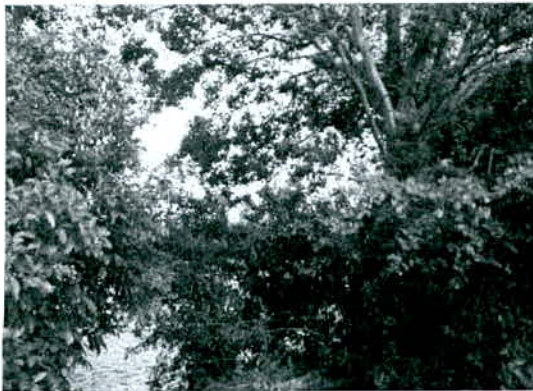
Foto N° 1. Árboles de porte alto mayores a 15 m. de altura en bosque secundario poco intervenido (...). (Folio 62).