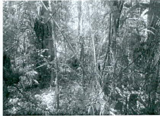
Foto N° 2. Árboles de porte alto dentro del bosque denso en bosque secundario poco intervenido.