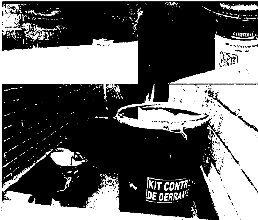
Figuras 1, 2 y 3. Almacenamiento inadecuado de residuos comunes con residuos peligrosos - Estación Don Diego

A continuación, se ilustran fotográficamente estos hallazgos: