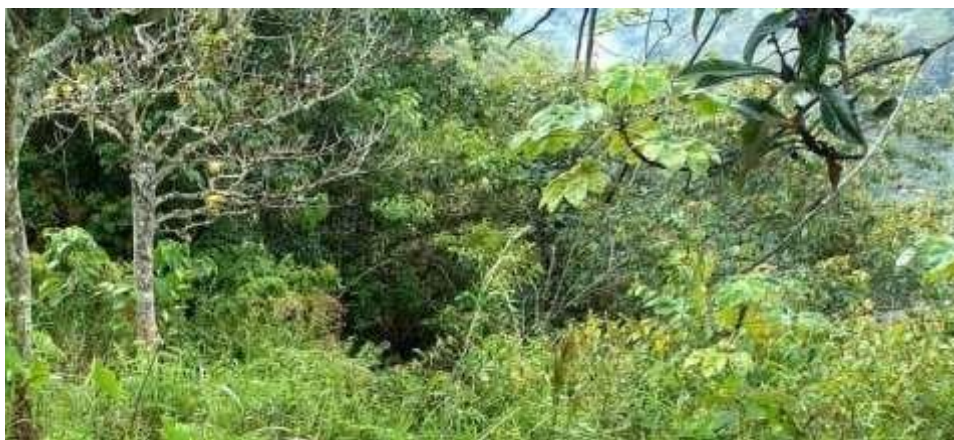
Imagen 1: Ecosistema presente en la RNSC Viracocha. Fuente: Concepto Técnico No. 20196030002143 del 17/09/2019

La RNSC VIRACOCHA, se encuentra ubicada en el Orobioma Subandino, de acuerdo con el Shapefile del IDEAM, código (ECOS07IGAC500K año 2008).