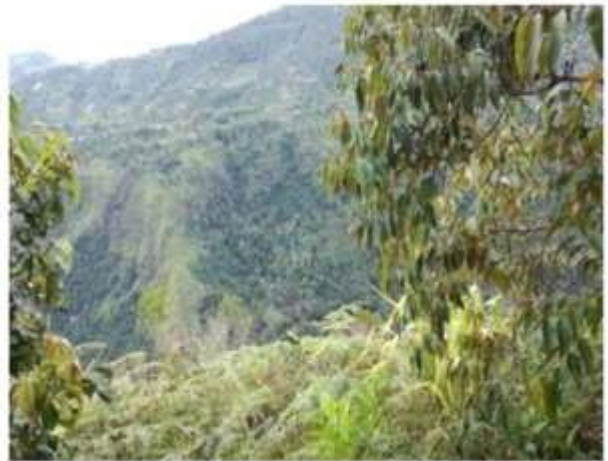
Ecosistema presente en la RNSC Viracocha