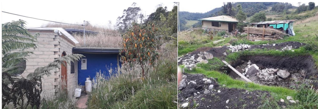
Área de casa habitacional y otra en construcción.

Con un área de 0,3423 es equivalente al 7,6 % del total del predio, esta zona comprende dos casas principales, una cabaña secundaria y un salón pequeño; adicionalmente y el carreteable que va de la vía principal a las cabañas.