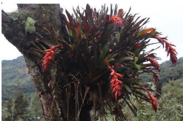
Bromelia o quiche: Tillandsia sp

La vegetación es un mosaico de pastizales y remanentes de bosque secundario y subpáramo, en diferentes estados de regeneración natural, especialmente exuberantes en las zonas con mayores pendientes. Estos remanentes de bosque presentan un dosel arbóreo conformado por especies que son elementos florísticos característicos de los bosques maduros de la región, se pueden observar: especies como el laurel ( Morella parvifolia ), el encenillo ( Weinmania tomentosa ), arrayán ( Mircianthes leucoxylla ) y sietecueros ( Tibouchina lepidota ). Las características de humedad de la zona, permiten encontrar varias especies de epífitas, como bromelias y orquídeas, así como de plantas no vasculares.