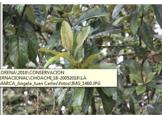
Duraznillo: Abatia parviflora