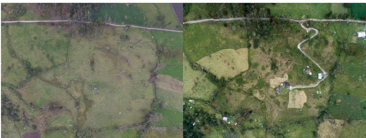
Imagen del predio antes y actual se puede observar su recuperación; imagen suministrada por el propietario.

La zona de conservación incluye el relicto de bosque nativo que actualmente se encuentra en la parte alta del predio, las zonas en donde en este momento se desarrollan acciones de restauración con especies nativas como encenillos, sangre de drago, alisos, guarumos, cedro negro y cedro rosado entre otros. Dentro de esta zona se encuentra además un apiario, las dos quebradas, el humedal en formación y los dos nacimientos pequeños.