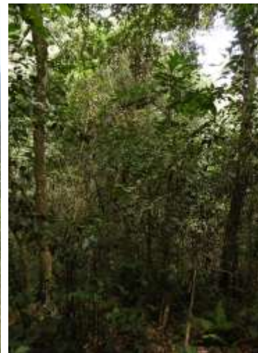
Interior del Predio

Algunos puntos de georreferenciación del predio: