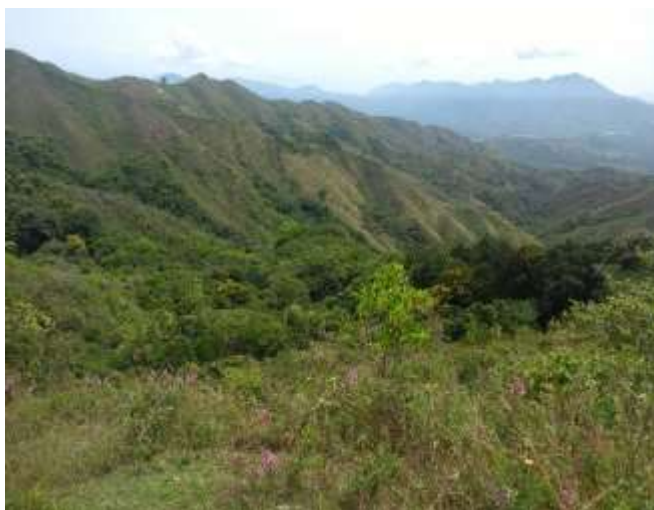
Panorámica del predio