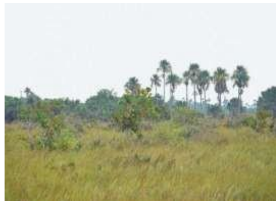
Figura 2. Bosque de galería y sabanas inundables con presencia de palma de moriche ( Mauritia flexuosa )