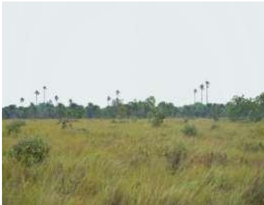
Figura 1. Sabanas naturales donde se desarrolla la ganadería extensiva.

El ecosistema de sabana inundable (Figura 1) corresponde a sabanas naturales donde se desarrolla la ganadería extensiva en praderas conformadas por pasto guaratara ( Axonopus purpusii ), tote ( Rhynchospora nervosa ), rabo de vaca ( Andropogon bicornis ), Rhynchospora globosa , entre otras. Además, se encuentran matas monte donde se encuentran elementos vegetales como el chaparro ( Curatella americana ), el bejuco chaparro ( Davilla nitida ), el malagueto ( Xylopia aromatica ), el vara blanca ( Casearia sylvestris ), la mora sabanera ( Miconia albicans y Clidemia sericea ), el quince días ( Tapirira guianensis ), el yarumo ( Cecropia sp.), entre otras. Parte de estas sabanas se inundan totalmente en el sector norte recogiendo las aguas que alimentan el caño Paravare y la cañada El Burro, donde se encuentra un morichal con dominancia de la palma Mauritia flexuosa ( Mauritia flexuosa ).