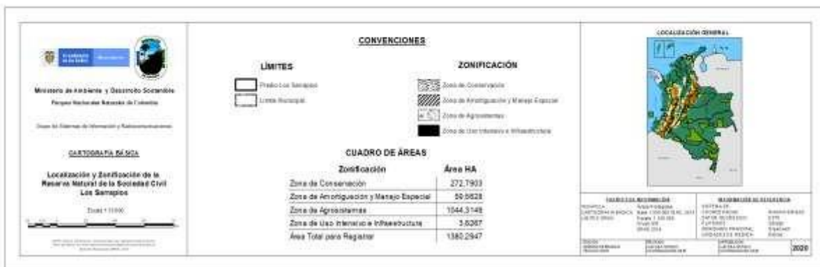
Figura 3. Zonificación RNSC "LOS SARRAPIOS"