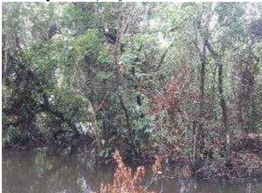
Imagen No. 1: Bosque de galería de la zona de Conservación.