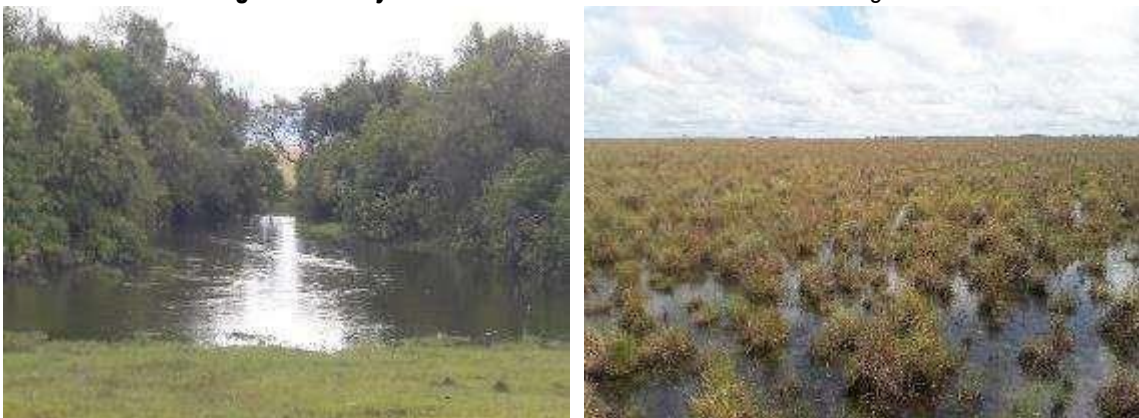
Imágenes No. 2 y 3: Sabanas inundables de la zona de Amortiguación.