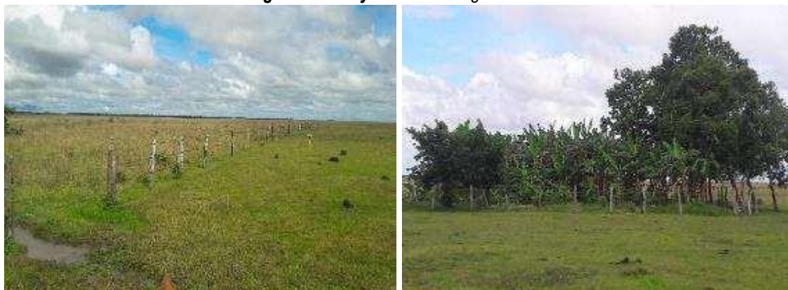
Imágenes No. 4 y 5: Zona de Agrosistemas.