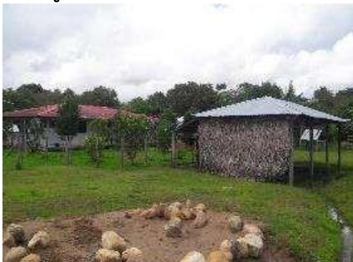
Imagen No. 6: Zona de Uso Intensivo e Infraestructura.