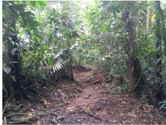
Imágenes del sendero interpretativo "El camino de la Mujer sabedora"