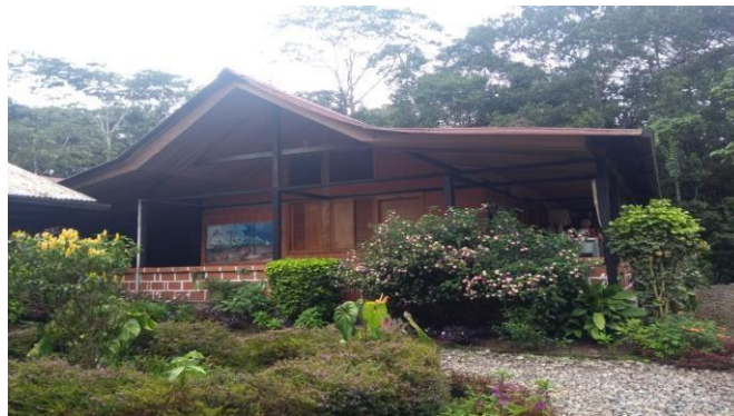
Aspectos de la Zona de uso intensivo e infraestructura.