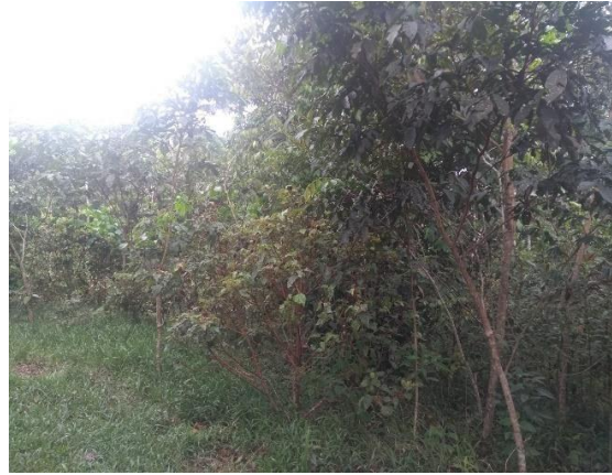
Imágenes de la chagra indígena, diversidad de especies en un mismo lugar.