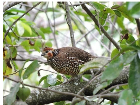
Figura 2. Avifauna presente en la vereda San Francisco de Santa María, Huila en donde se ubica la RNSC “LA TRIGUEÑA Y LAS DELICIAS”: de izquierda a derecha y de arriba abajo: Terlaque pechiazul ( Andigena nigrirostris ), Arañero cabecirrufo ( Basileuterus rufifrons ), Gavilan aliancho ( Buteo platypterus ), Perdiz chilindra ( Colinus cristatus littoralis ). Fuente de información y determinaciones por Biólogo Dilmer Arias Hermida, 2019.