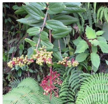
Figura 3. Flora presente en la RNSC “LA TRIGUEÑA Y LAS DELICIAS”.