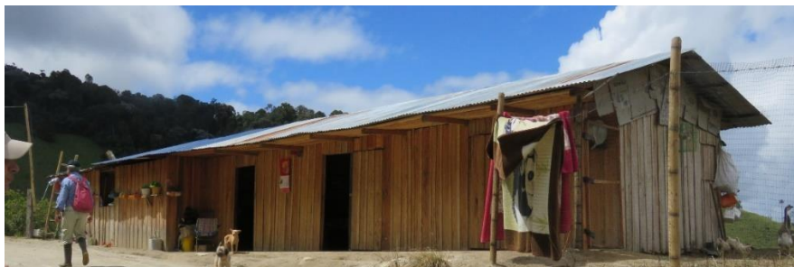
Figura 7. Zona de Uso Intensivo e Infraestructura, RNSC "LA TRIGUENA Y LAS DELICIAS".