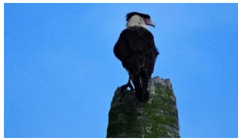
Continuación Figura 2: Avifauna presente en la vereda San Francisco de Santa María, Huila en donde se ubica la RNSC “LA TRIGUEÑA Y LAS DELICIAS”: de izquierda a derecha y de arriba abajo: Turpial montañero ( Icterus chrysater ). Colibrí chillón ( Colibri coruscans ), Azulejo real ( Buthraupis montana ), Caracara moñudo ( Caracara cheriway ). Fuente de información y determinaciones por Biólogo Dilmer Arias Hermida, 2019.