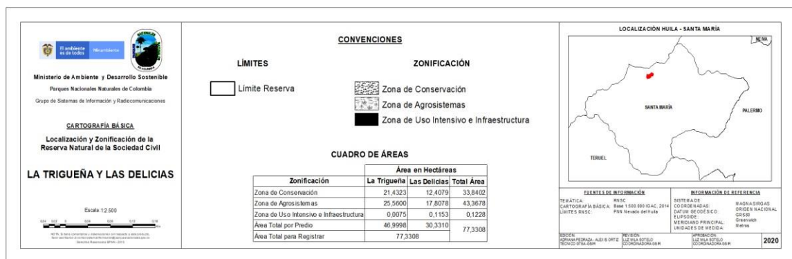
Figura 4. Zonificación propuesta para la RNSC "LA TRIGUENA Y LAS DELICIAS" de acuerdo con la sección 17 del Decreto 1076 de 2015.