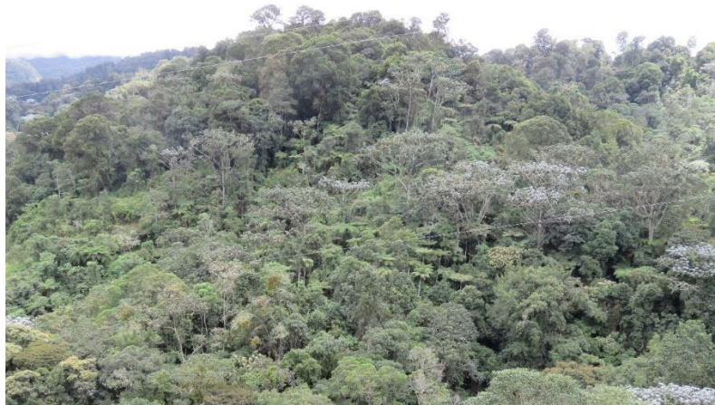
Figura 1. Ecosistema de Bosque Alto Andino en la RNSC "LA TRIGUEÑA Y LAS DELICIAS".

De acuerdo con lo mencionado por los acompañantes de la visita técnica, en la RNSC "LA TRIGUEÑA Y LAS DELICIAS" es posible observar la siguiente fauna: