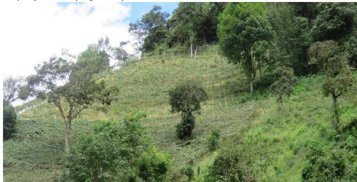
Figura 6. Zona de Agrosistemas, RNSC "LA TRIGUENA Y LAS DELICIAS".

4.2 ZONA DE AGROSISTEMAS: Esta zona corresponde al 56,08% (43,3678 ha) de la reserva distribuidas en zonas con potreros para ganadería y otras zonas para establecimiento de cultivos como granadilla, frijol, gulupa y mora (Figura 6).