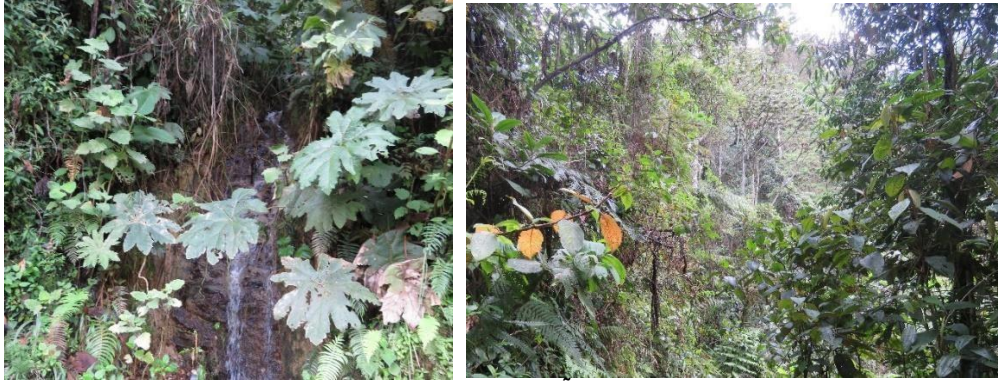
Figura 5. Zona de conservación de la RNSC "LA TRIGUENA Y LAS DELICIAS".

4.1 ZONA DE CONSERVACIÓN: Esta zona corresponde al 43.76% del total del área a registrar, es decir a 33,8402 ha. Esta zona, está representada por el Ecosistema Bosque Alto Andino (Figura 1, 2, 3 y 5).