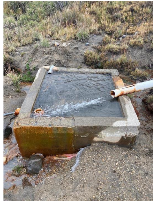
Ilustración 3. Caja desarenador.

De este tanque sale una manguera de polietileno de 1" que recorre una distancia de 70 metros hasta llegar a un tanque sedimentador (no funcional) del cual se derivan dos tanques de cloración no funcionales de 500 litros cada uno, de allí salen por un tubo de 3" hacia tres tanques de 10000 L cada uno, los cuales distribuyen el agua por medio de una tubería de PVC de 2" hasta la cabaña de arenales,