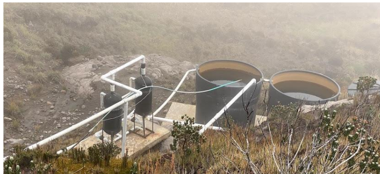
Ilustración 5. Tanques de cloración

Es necesario remitir los planos y diseños y realizar mantenimiento del sistema, dado que durante la inspección se determinó que los tanques sedimentadores y el tanque de cloración no están prestando ningún servicio, adicionalmente es necesaria la instalación de un macromedidor que permita controlar el paso del caudal y facilitar el seguimiento.