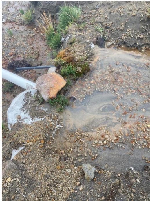
Ilustración 2. Sitio de captación represa en concreto