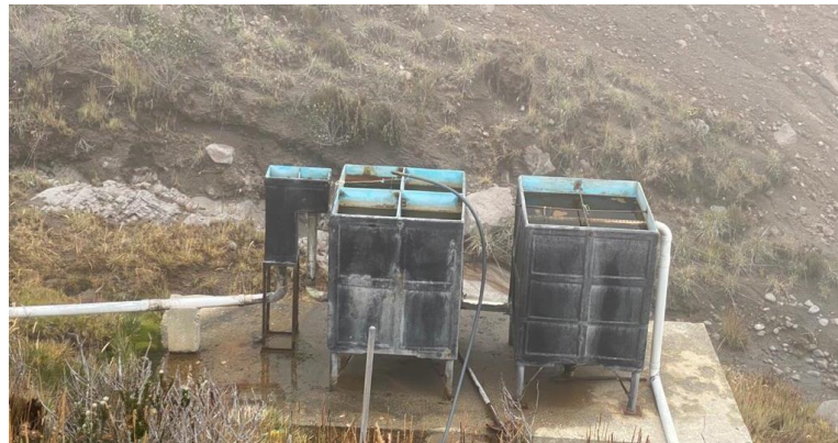
Ilustración 4. Tanques sedimentadores

De este tanque sale una manguera de polietileno de 1" que recorre una distancia de 70 metros hasta llegar a un tanque sedimentador (no funcional) del cual se derivan dos tanques de cloración no funcionales de 500 litros cada uno, de allí salen por un tubo de 3" hacia tres tanques de 10000 L cada uno, los cuales distribuyen el agua por medio de una tubería de PVC de 2" hasta la cabaña de arenales,