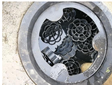
Foto 2 y 3. Sistema séptico y material filtrante