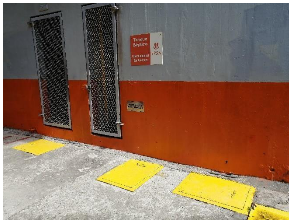
Foto 1. Tanque Séptico Instalaciones operativas

El tanque séptico de las oficinas tiene una capacidad de 4.81 m 3 , mientras que el de las instalaciones operativas es de 1 m 3 , este segundo tanque séptico cuenta además con un tanque de bombeo que conduce las aguas a la cámara trampa de retención de flotantes, en este tanque hay instaladas 2 bombas sumergibles que funcionan en alternancia.