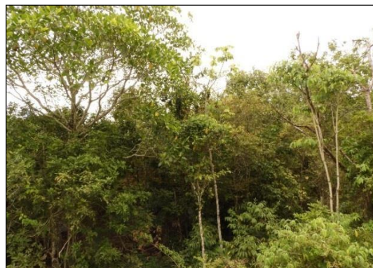
Fotografía 2. Bosque Seco “Bellavista”