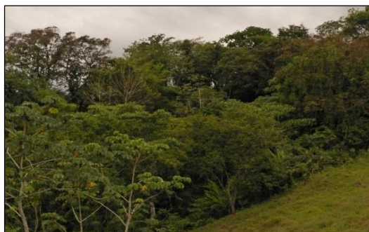
Fotografía 3. Bosque Seco