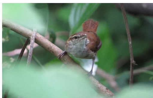
Tabla 4. Aves de la RNSC Bellavista, fuente visita técnica DTAO 4 abril de 2019