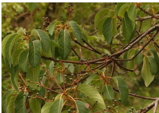
Tabla 2: Algunos árboles presentes.