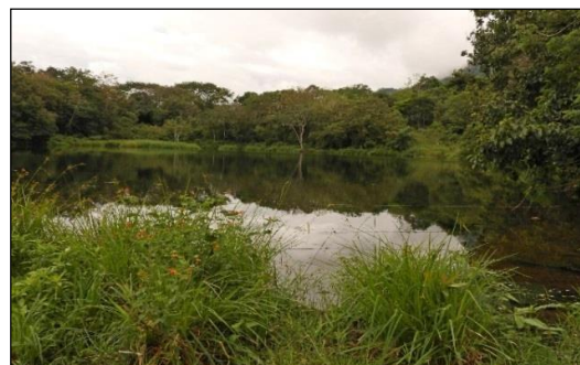
Fotografía 4. Humedal dentro del predio “Bellavista”