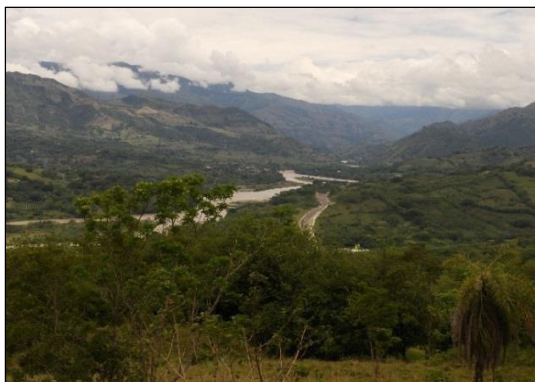
Fotografía 1. Bosque Seco “Predio Cortesita”.

Otro de los argumentos para justificar que la reserva hace parte del bosque seco fue porque se evidenció en el momento de la visita la diversidad de leguminosas, cactus y plantas espinosas propias de dicho ecosistema. La altura dentro la cual se encuentra la RNSC Bellavista no excede los 1.000 msnm, y que según (Espinal, 1961) hacen parte de bosque seco del cañón del Río Cauca que va desde la Pintada en los límites de departamento de Caldas hasta antes de llegar a Puerto Valdivia. La zona de vida incluida en este bioma es el bosque seco tropical (bs-T), la cual tiene como límites climáticos generales de una biotemperatura superior a 24°C.(González & Juan Lázaro Toro M, 2005).