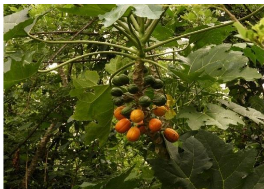
Fotografía 5 y 6. Árboles presentes en la RNSC Bellavista; fuente visita 4 abril de 2019.