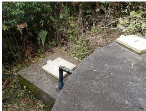
Foto 4. Tanque de Almacenamiento

Tanque de almacenamiento: los archivos de diseño del acueducto estipulan que el tanque de almacenamiento del acueducto tiene una capacidad mínima de almacenamiento de 50 m 3 , con una altura efectiva mínima de 1.5 metros (altura total 1.7 metros). Se encuentra ubicada en las coordenadas N: 04°55'57.87" y W: 76°05'03.65" a una altura de 2158 msnm.