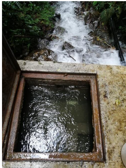
Foto 2. Estructura de captación y cámara de inspección

Bocatoma: La bocatoma tiene captación de fondo con rejilla, la cámara de recolección es de 0.6 m x 0.4 m y 1 m de profundidad. La bocatoma además posee un desagüe para el caudal de excesos y una salida que conduce el agua al desarenador, la tubería de aducción es de 3" de diámetro y conduce el agua hasta el desarenador, se encuentra ubicada en las coordenadas N: 04°56'03.19" y W: 76°05'21.02" a una altura de 2230 msnm.