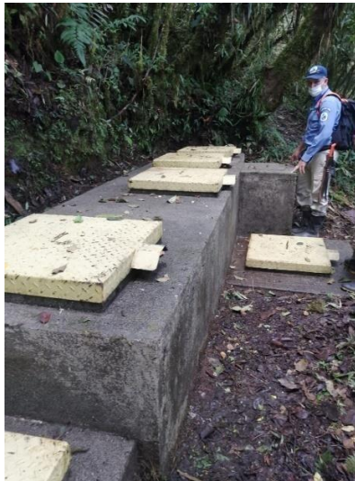
Foto 3. Desarenador

Tanque de almacenamiento: los archivos de diseño del acueducto estipulan que el tanque de almacenamiento del acueducto tiene una capacidad mínima de almacenamiento de 50 m 3 , con una altura efectiva mínima de 1.5 metros (altura total 1.7 metros). Se encuentra ubicada en las coordenadas N: 04°55'57.87" y W: 76°05'03.65" a una altura de 2158 msnm.