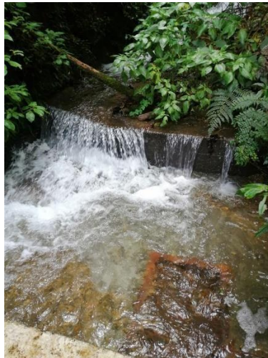
Fotos 1 Bocatoma quebrada La Mesenia