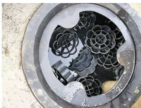
Foto 2. Material filtrante

El Sistema cuenta con un tanque Filtro Anaerobio de Flujo Ascendente de capacidad 2000 litros y recibe las aguas de los pozos sépticos, este elemento permite una remoción mayor de las cargas contaminantes del agua residual.