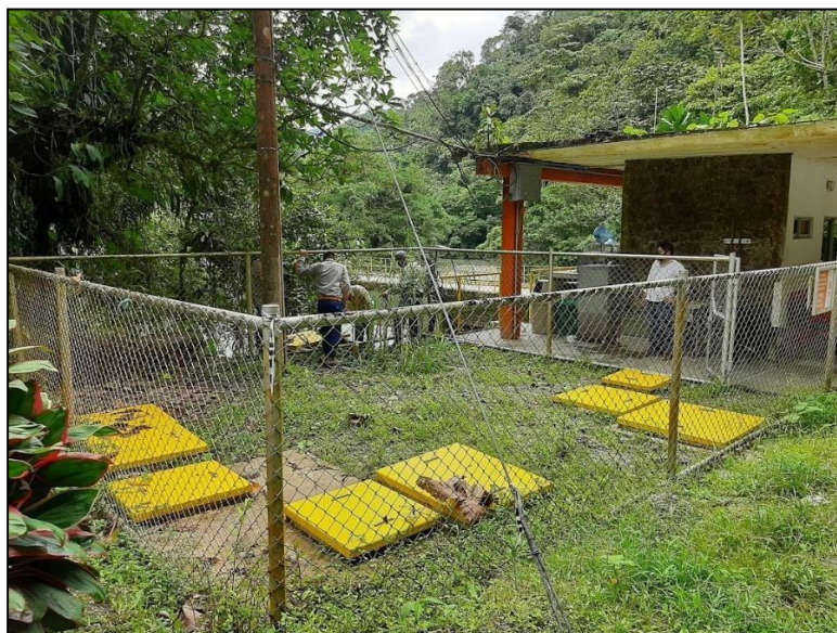
Foto 1. STARD Portería Alto Anchicayá

El Sistema de Tratamiento cuenta un tanque séptico de 4000 litros de capacidad, que recibe las aguas de los baños y las cocinetas de la portería y de las instalaciones Militares.