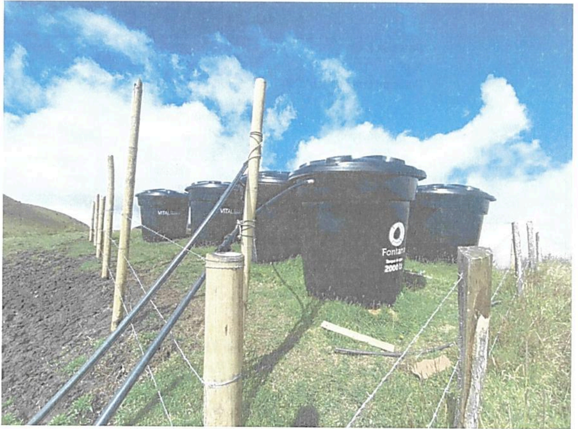
Fotografía 3. Tanques de almacenamiento.