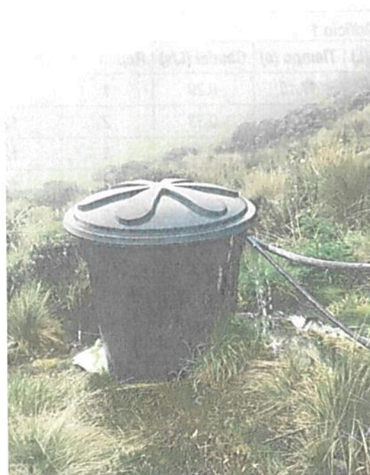
Fotografía 2 Tanque desarenador y retorno de excesos