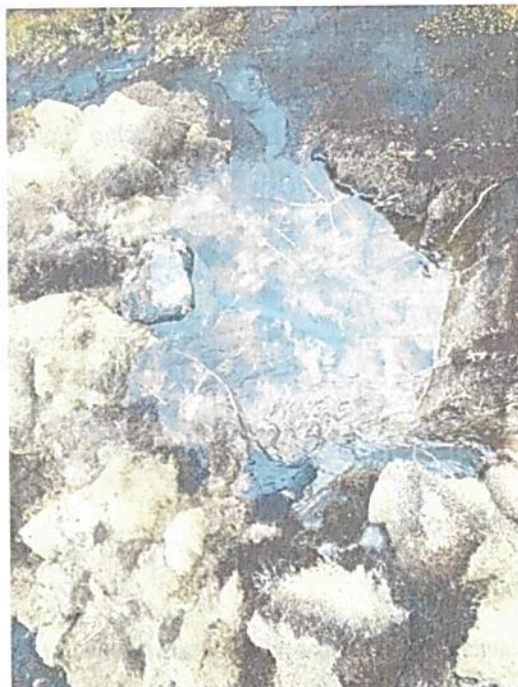
Fotografía 1. Captación manguera de 1"