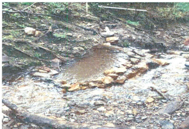
Ilustración 3. Estructura del tanque de almacenamiento.