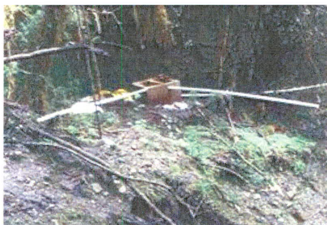
Ilustración 4. Tanque de almacenamiento