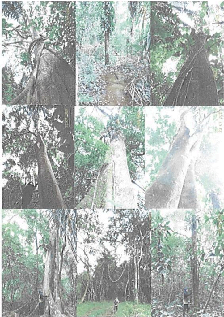
Figura 3. Parte de la vegetación encontrada en los recorridos.