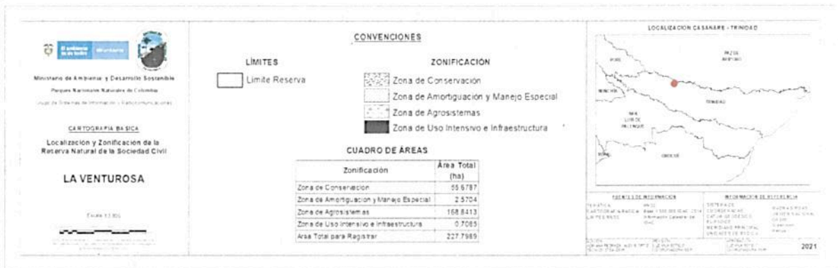
Figura 6. Zonificación para la RNSC "LA VENTUROSA".