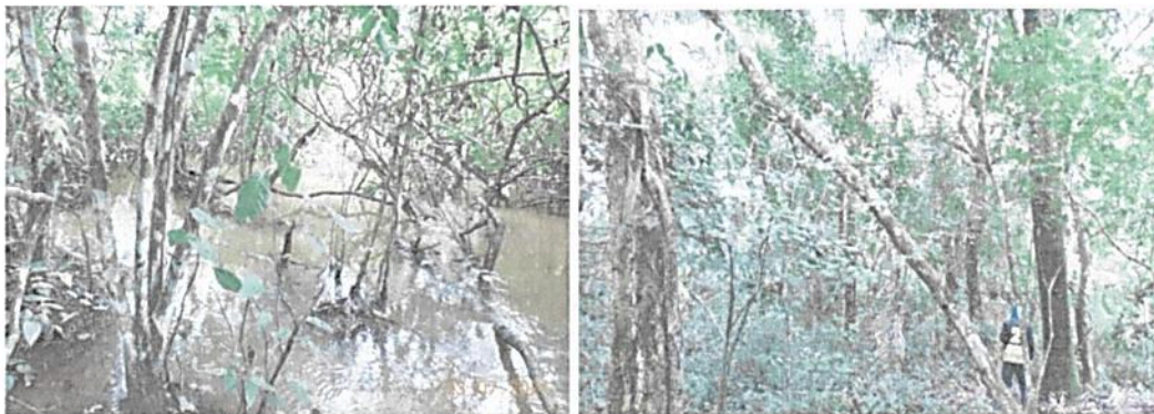
Figura 1. Aspecto de la vegetación presente en varios sectores de los predios.

De acuerdo con los recorridos realizados en la visita técnica, la información relacionada en el expediente y lo reportado por el mapa de ecosistemas del IDEAM 2017 se encuentra una muestra de Bosque inundable basal