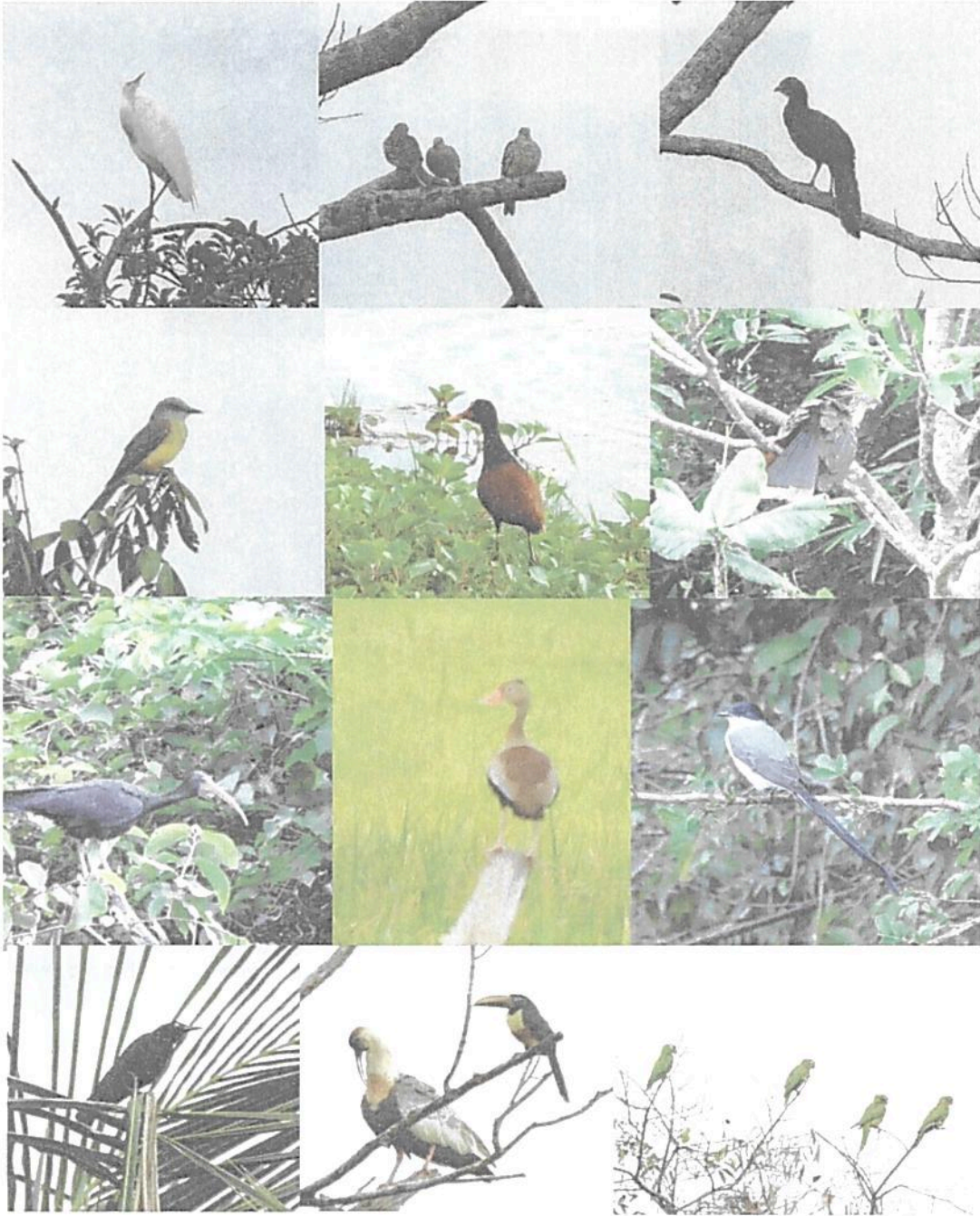
Figura 2. Parte de la avifauna encontrada en los recorridos.