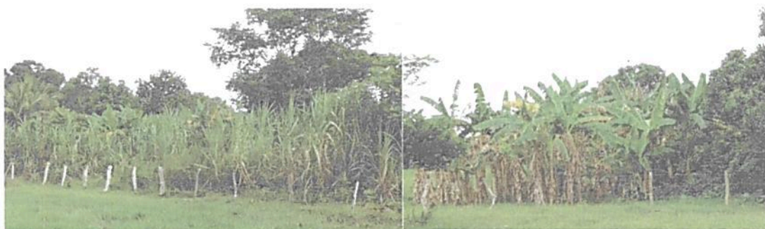
Figura 5. Pasto de corte, plátano, maíz, yuca, entre otros cultivos se encontraron en la zona de agrosistemas.

Corresponde al 74,12% del área propuesta para registro (168,8413) y está conformada por pasturas para el ganado, un cultivo de arroz y algunos cultivos de pancoger. El hijo de la propietaria, principal encargado de las actividades en la finca manifiesta que se está haciendo la transición de las áreas de arroz hacia la siembra de pasturas para ganadería de cría y ceba, dado que el cultivo cada vez es menos rentable y demanda un gran esfuerzo para su mantenimiento y cosecha. De igual forma manifiesta que se está mejorando las prácticas agrícolas con el fin de conservar y mantener las áreas naturales dado que es uno de los principales atractivos de la finca. Dentro de los cultivos que se tienen se encuentran el plátano, la caña, yuca, maíz; frutales como mango, naranjos, limón mandarino y castillo, tamarindo, papaya, mamoncillo entre otros. Se tienen algunas cabezas de ganado para leche y carne, cerdos, gallinas y patos.