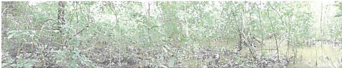
Figura 4. Muestra de un sector inundable dentro del área de conservación. Fuente visita PNN.

Cubriendo un área de 55,6787 hectáreas (24,44%) de la superficie de registro, está conformada por un bosque inundable basal perteneciente a la cuenca del caño Santa Marta. Esta constituida por un bosque abierto con algunos sectores densos y arboles de hasta 25 metros aproximadamente de altura, por su naturaleza inundable se presentan espejos de agua intermitentes que oscilan en área y profundidad de acuerdo con la alternancia de las temporadas de lluvias(Figura 4).