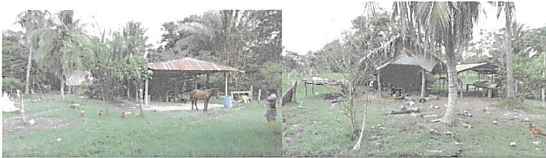
Figura 7. zona de uso intensivo, predio "La Venturosa".

Con 0,7085 ha. (0,31%) está conformada por la zona de vivienda, cocina, patio de molienda, y otras pequeñas construcciones para el mantenimiento de especies menores y almacenamiento de alimentos y descanso.