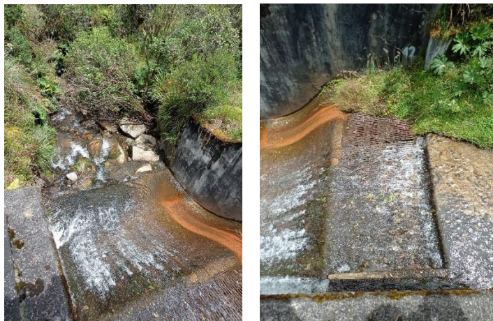
Fotos 1 y 2. Quebrada Calostros

Actualmente no existe infraestructura sobre la fuente hídrica