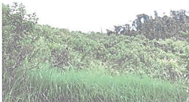
Imagen 5. Foto tomada durante la visita al predio Casa De Zinc Vereda Las Palomas

Conflicto de uso: De acuerdo con la vocación del suelo y uso de este en el predio, la finca presenta muy poco conflicto de uso, ya que de acuerdo a la cartografía de CORPOCALDAS, el uso potencial del suelo corresponde con la ocupación actual del mismo que es la conservación de recursos hidrobiológicos y los sistemas agroforestales de clima frío.