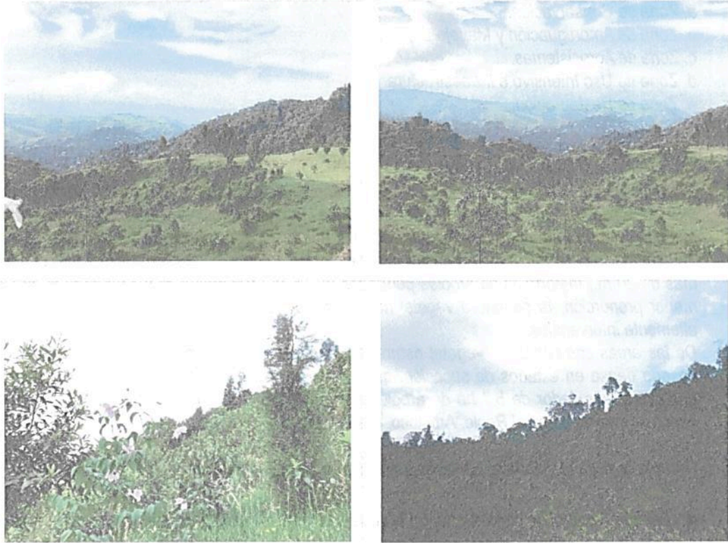
Imagen 1, 2, 3 y 4: fotografías tomadas durante la visita realizada al predio Casa De Zinc Vereda Las Palomas.